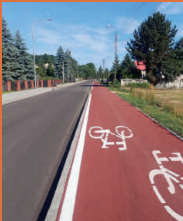
ul. Zawodzie w Wojkowicach Kościelnych