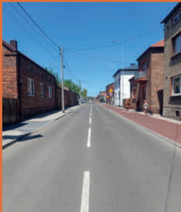
ul. Piłsudskiego w Siewierzu

Przy tej okazji zwracamy się z prośbą o poszanowanie efektów wykonanych prac i nieparkowanie samochodów na ścieżkach rowerowych tylko w miejscach do tego celu wyznaczonych. Wszystkim mieszkańcom dziękujemy za cierpliwość i wyrozumiałość, którymi wykazali się w czasie prowadzenia działań budowlanych i remontowych.