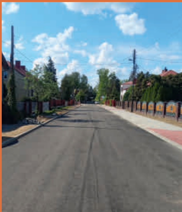
ul. Żeromskiego w Siewierzu