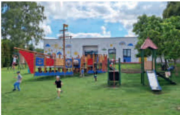
Budowa żłobka zrealizowana z udziałem środków z KPO

Budynek został przystosowany do opieki nad 24 maluchami w wieku 1-3 lata. Jest w pełni dostępny dla osób z niepełnościami. Jest to już drugi publiczny żłobek w naszej gminie. Stwarza on młodym rodzicom możliwości połączenia pracy z życiem osobistym i powrót do aktywności zawodowej w terminie, który uznają za optymalny. Wysokość dofinansowania w ramach programu Aktywny Maluch 2022–2029 ze środków KPO wyniosła niemal 1,4 miliona złotych, a ze środków z budżetu państwa pochodzących z podatku VAT 317 tysięcy złotych. Łącznie dało kwotę prawie 1,7 miliona złotych wsparcia.