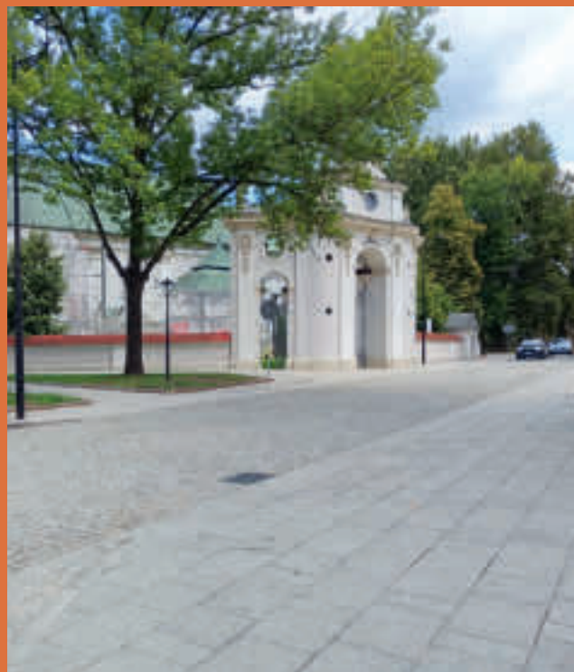
ul. Kościuszki w Siewierzu