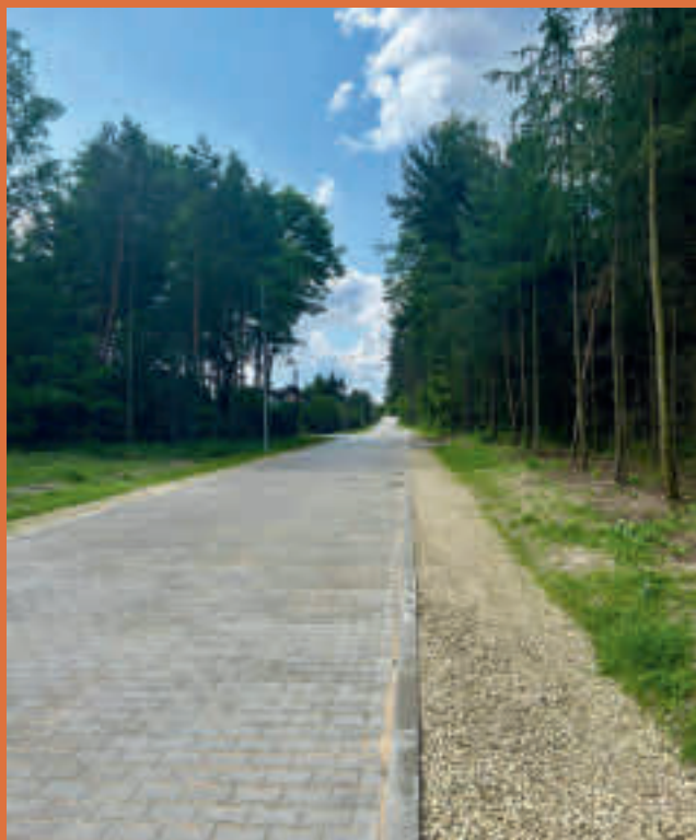
droga boczna od ul. Karsów w Wojkowicach Kościelnych